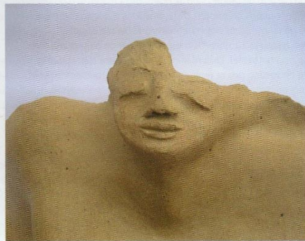
Su Melo, Wind (detail), 2013; steengoed, handmatig opgebouwd; h. 27 x 39 x 32 cm.

Het moment dat Su begint met een nieuw werk is niets anders dan een moment van zelfbeschouwing. "Een van de belangrijkste vragen die daarbij naar boven komt is: Op welk moment in het proces kan ik de reguliere structuren van de wereld om ons heen doorbreken? Wat ik probeer te laten zien, is de mogelijkheid die wij hebben om samen een werkelijkheid te scheppen. Verander daarbij de gewone percepties en doorbreek structuren, met het uiteindelijke doel om jezelf beter te voelen. In het Spaans betekent het woord 'inspiración' hetzelfde als ademen. Mijn inspiratie voelt ook precies als dat, ik denk dat mijn sculpturen mijn manier zijn om uit te ademen."