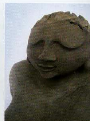
links: Overzicht van de Udu workshop van Su Melo bij Kermikos Haalem, december 2014. Foto Herkeltin Groskamp | midden: Su Melo, Guatona , 2013; steengoed, handmatig opgebouwd; h. 39 x 52 x 23 cm. Foto Su Melo | rechts: Su Melo, La negra (detail), 2013; steengoed, handmatig opgebouwd; h. 27 x 21 x 23 cm. Foto Su Melo